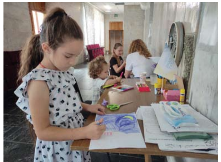
Šiame Zaporižės humanitarinės pagalbos centre aptarnaujami vien pabėgėliai iš Melitopolio, o pabėgėlių vaikai skatinami piešti, tikintis, kad taip jie užmirš patirtus sukrėtimus.