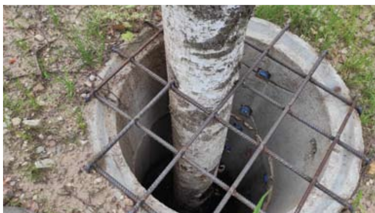
Štai toks sprendimas buvo pasitelktas, siekiant išsaugoti pakelėje augančius beržus.

„Laba visiems, tai yra ką tik rekonstruotoje Žvejų g. Anykščiuose. Trys nuostabūs beržai paruošti skerdimui, ne kitaip. Čia tokios išsaugojimo technologijos? Prašau paaiškinkit?!“ - prašė menininkė.