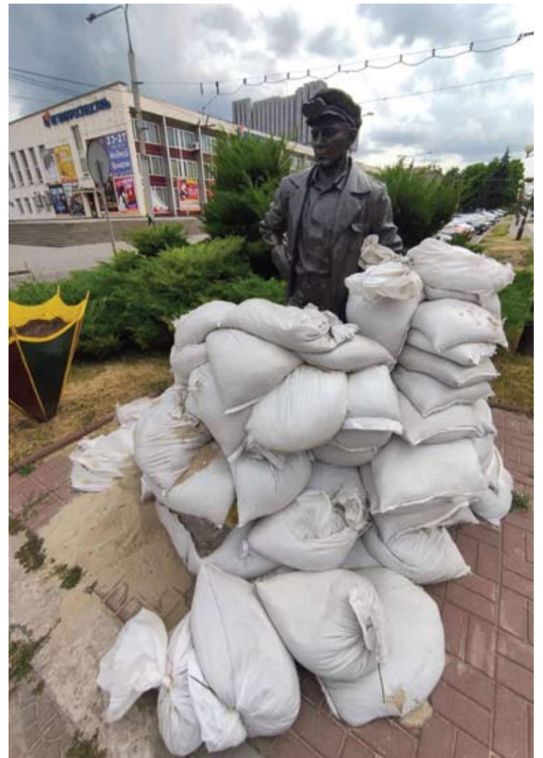
Zaporižės centre esančio parko skulptūros nuo sunaikinimo saugomos smėlio maišais.

Rusų kariai tikrina gyventojų telefonus ir, jei randa Ukrainą palaikančių įrašų, vežasi į perauklėjimo paskaitas, o neretai ir areštuoja kelioms dienoms. Okupantai vis vien esą remiami mažumos gyventojų, o dauguma laukia, kol bus išvaduoti ukrainiečių kariai.