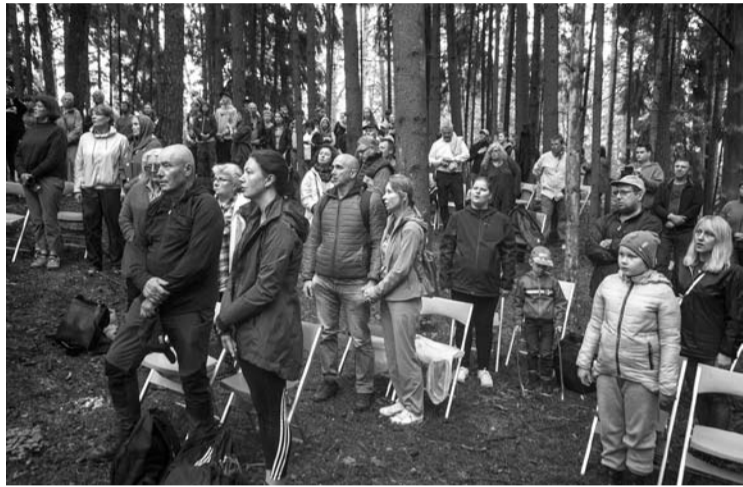
Ant Palatavio Tautišką giesmę giedojo per du šimtus piliečių.

Skambėjo kanklės, dainuotos gražiausios lietuviškos dainos, didingai skleidėsi iš širdies giedamas Lietuvos himnas. Iškilmingos šventės pašaukti žygiavo žygeiviai, o mažasis siaurukas atsiliepė į iškilmių ritmą linksmu ratų bildesiu.