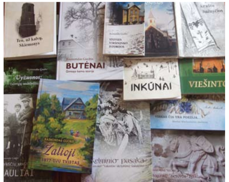
Nors ir ne visos, bet labai daug knygų...