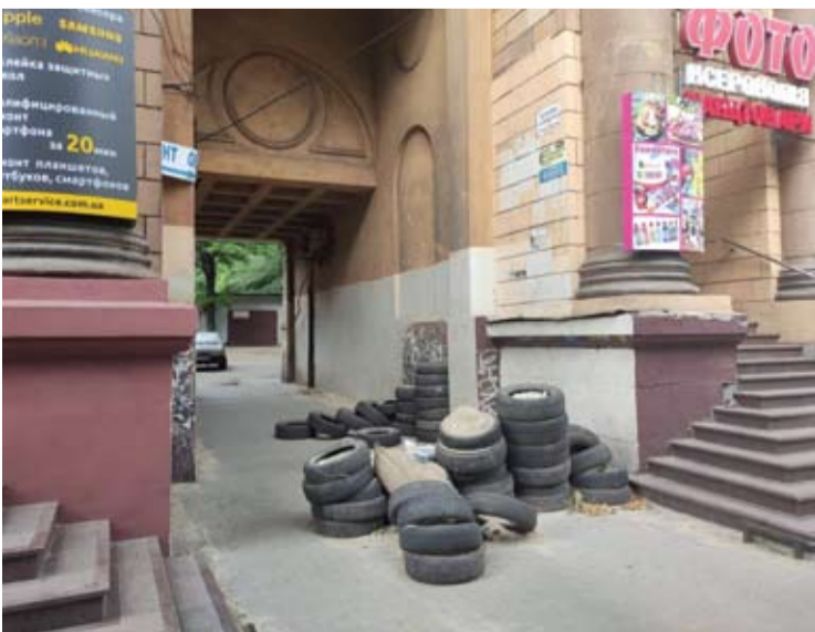
Iš padangų sukrautos barikados.