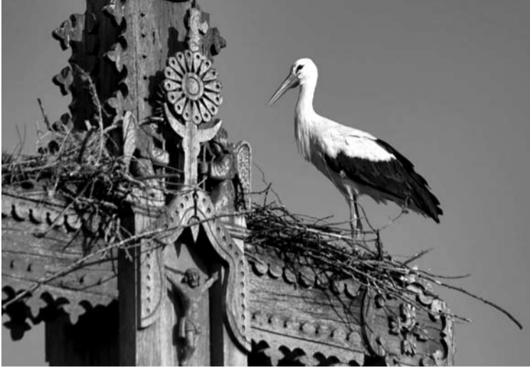
Gandrai nusprendė įsirengti namus ant Butėnų kryžiaus.

Nors gandrums buvo paruošta kita vieta, tačiau kryžius jiems patiko labiau, todėl nesiliauja atkakliai lizdą sukurti ant kryžiaus.