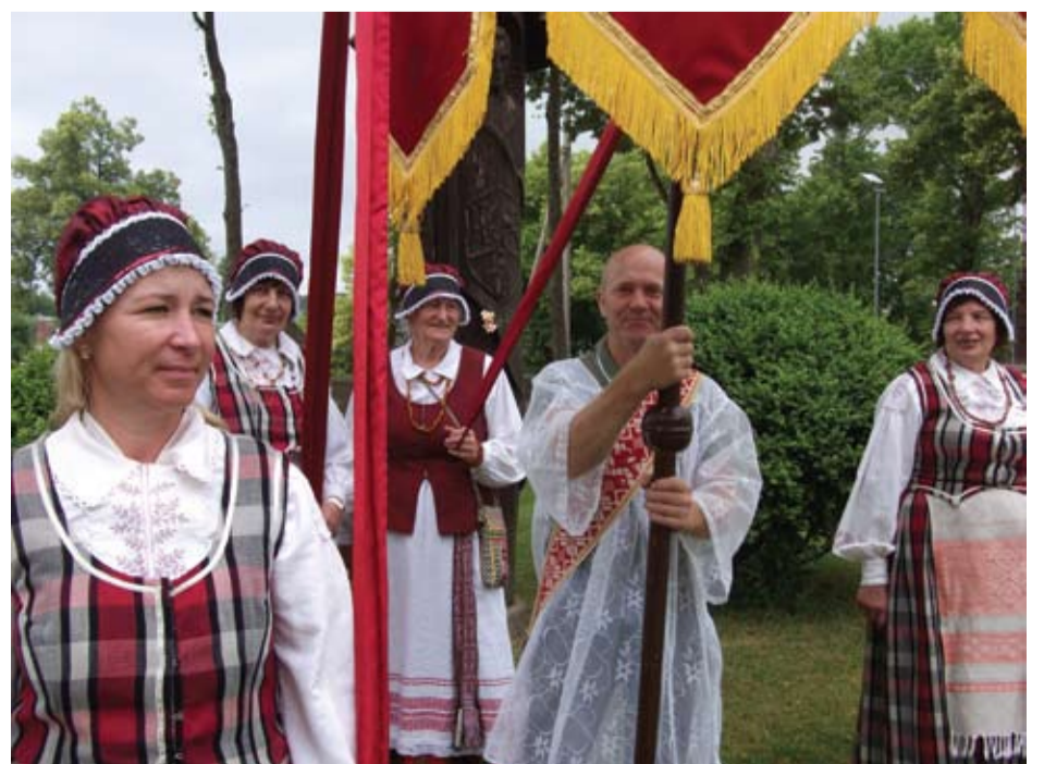
Procesijos spalvingas iškilmingumas...