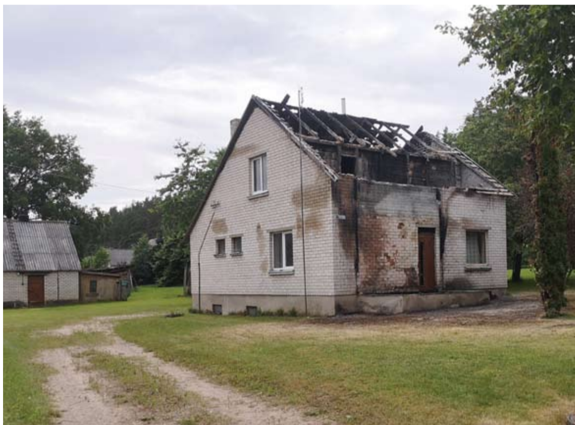
Mūrinis namas Andrioniškyje greičiausiai užsidegė dėl elektros instaliacijos gedimo.