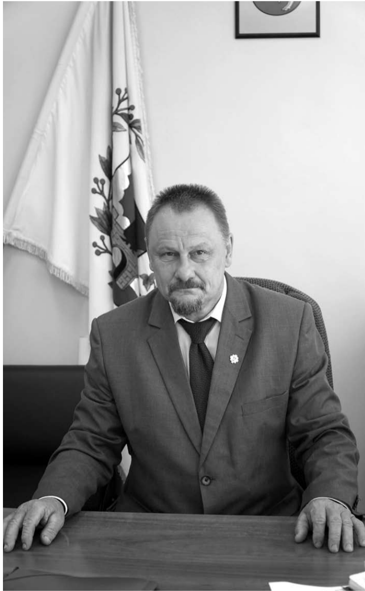
Anykščių rajono meras Sigutis Obelevičius.

2022 m. birželio 3 d. Anykščių rajono savivaldybės tarybos sprendimu Nr. 1-TS-172 „Dėl pritarimo Anykščių rajono savivaldybės 2021 m. veiklos ir Anykščių rajono savivaldybės mero 2021 m. veiklos ataskaitai“ patvirtinta Anykščių rajono savivaldybės 2021 m. veiklos ir Anykščių rajono savivaldybės mero 2021 m. veiklos ataskaita. Visuomenai pristatome praėjusių metų ataskaitos santrumpą.